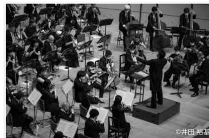
日本フィルが届けるクラシック音楽

東日本大震災の被災地に300回以上音楽を届けている日本フィルは、未来を担う東北地方の子どもたちの夢と笑顔を応援するため、東北各地で音楽や芸能活動を行う団体を招き「東北の夢プロジェクト」を開催しています。去る7月22日には2年ぶりに岩手県盛岡市での公演が実現し、宮古高校吹奏楽部(宮古市)、気仙町けんか七夕太鼓(陸前高田市立気仙小学校)がゲスト出演しました。会場には1,000名を超えるお客様が詰めかけ、子どもたちの熱演とオーケストラ、バレエの上演に対して温かい拍手を頂きました。いずれの団体もコロナ禍により活動に制約を受けているものの、多くの聴衆を前にその力を存分に発揮し、若々しい熱演を披露しました。これからも日本フィルは東北地方での「新たな文化発信」と「地域を超えた交流の場づくり」を目指し、この活動を続けていきます。ぜひとも多くの皆様とともに子どもたちの未来を応援したいと思います。