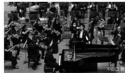
PHOTO 2 9月5日の芸劇シリーズでは、正指揮者山田和樹と清水和音さんをお迎えし、ラフマニノフのピアノ協奏曲第3番とホルストの《惑星》をお届けいたしました。山田マエストロ、今回初めて《惑星》を指揮したとのこと。harmonia ensembleさんによる神秘的な歌声も耳に響きました。アーカイブ配信中です。