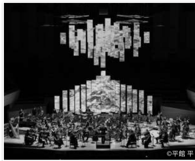
PHOTO 1 第5弾となる落合陽一×日本フィルプロジェクトは、「醸化する音楽会」—五感、解禁!—と題し、音楽と映像、味、香りのマリアージュをお楽しみいただきました。