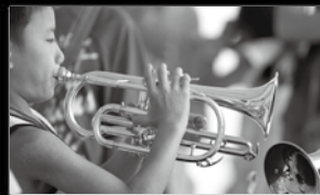
春休みオーケストラ探検より 楽器体験