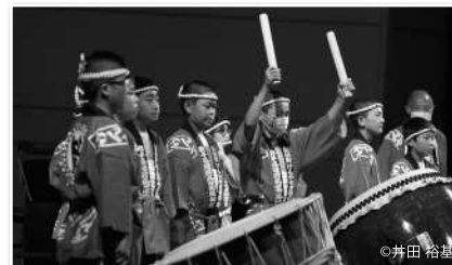
けんか七夕太鼓の迫力ある演奏