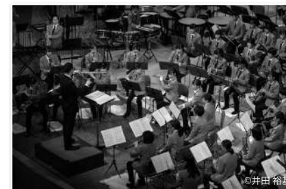
宮古高校吹奏楽部のリズムカルな演奏