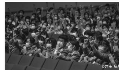
会場みんなで盛り上がる第4部