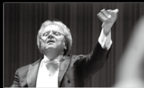
日本フィル杉並公会堂 シリーズ公演より

日本フィルは杉並公会堂を活動拠点とし、 様々な活動を通じて音楽文化を発信しています。