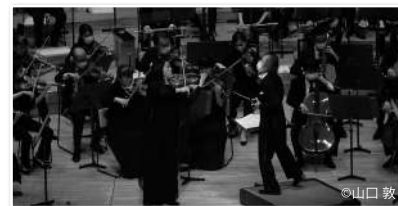
PHOTO 5 9月19日は小林マエストロとの大人気コンサート、コバケン・ワールド。前半は周防亮介さんをお迎えし、フランスの作曲家が生み出したヴァイオリンとオーケストラのための名品をお楽しみいただきました。プログラムの後半は、ベルリオースの幻想交響曲。オーケストラの演奏つきでマエストロの解説もありました。